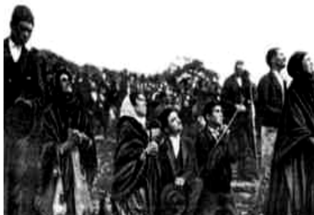
Miles de personas se reunieron en Fátima a esperar a la virgen.

Los incidentes en Cova da Íria comenzaron a ser publicados en los periódicos de Portugal, llamando la